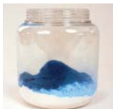
대략 10g의 염색 된 옥수수 전분을 60g의 락토오스 분말을 혼합 용기에 넣는다.

실험장비 : Lab 1 Mixer (3D Inversion arm) 샘플 : Pharmacy grade Lactose & Dyed corn starch 용기 사이즈 : 750ml jar (material PET) 혼합 시간 : 1분 30초