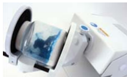
용기를 Lab 1 Mixer 에 장착후 60rpm 에서 90초간 혼합