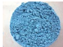
믹서로 혼합 시킨후 파우더 상태